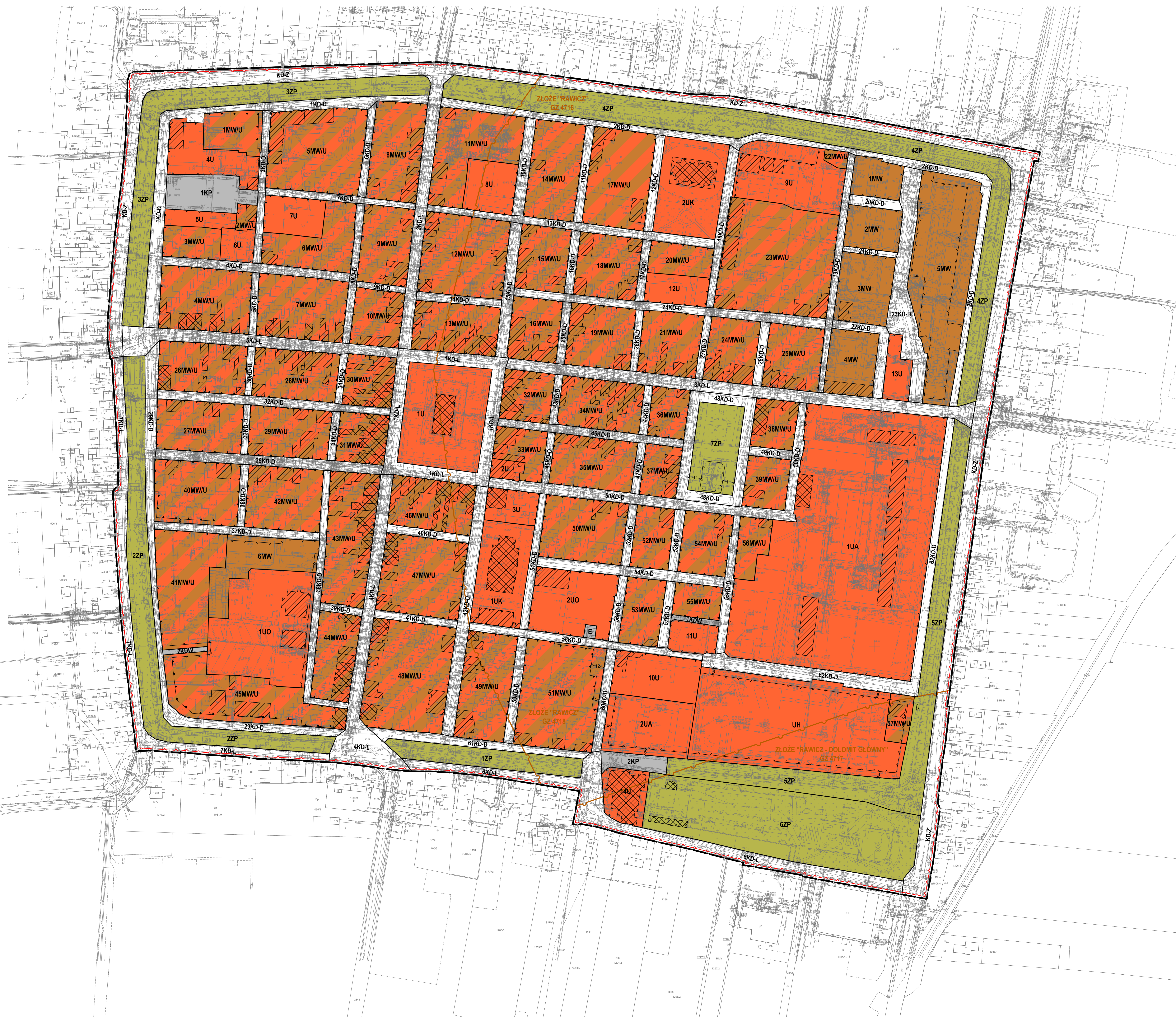
WYRS ZE STUDIUM UWARUNKOWAŃ I KIERUNKÓW ZAGOSPODAROWANIA PRZESTRZENNEGO GMINY RAWICZ Z OZNACZENIEM GRANIC OBSZARU OBJĘTEGO PLANEM SKALA 1:10 000